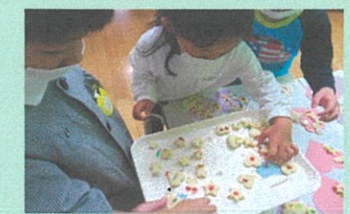
トッピングに夢中な子どもたち♡