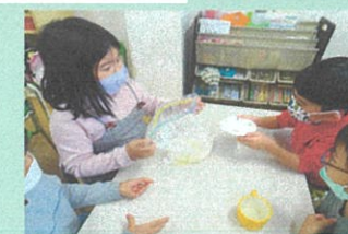
材料を合わせて生地を作ります☆